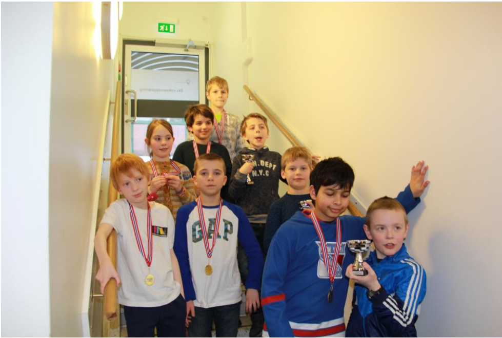
Deltakerne i Miniputt klassen