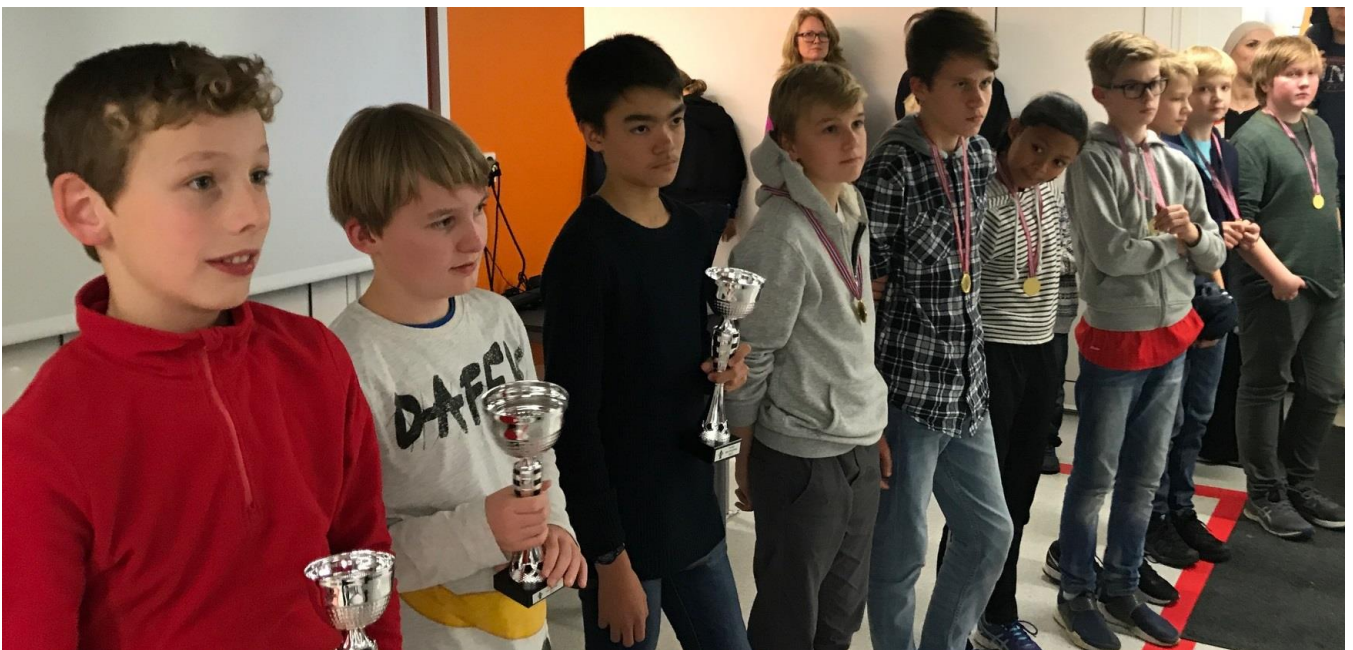
Gruppe C: 13 år