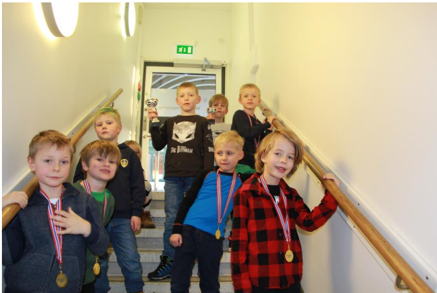
Deltakerne i Begynner 1 klassen