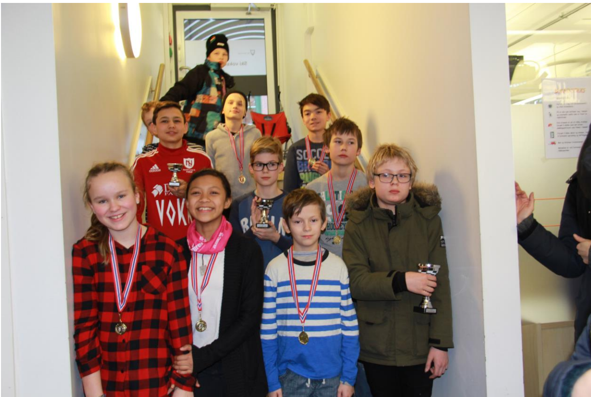
Deltakerne i Lilleputtklassen.