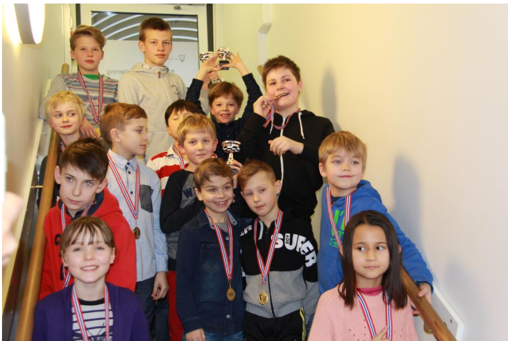
Deltakerne i Begynner 2 klassen